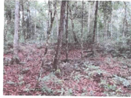
Figura 2. Montículos alrededor de la plaza.