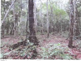
Figura 1. Es una plaza.