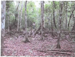
Figura 3. Altura de los montículos.